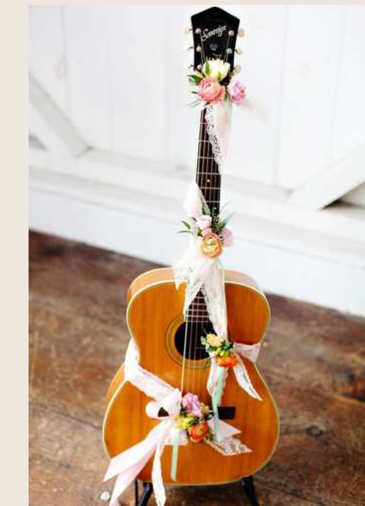
MONTE SUA BANDA