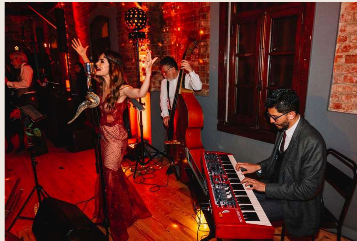
Festa temática -Jazz Anos 20 - Lisboa