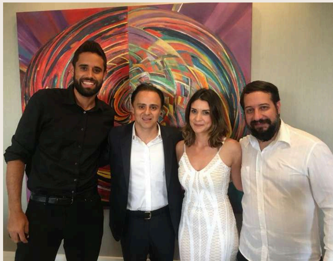
Coquetel do piloto de F1 Felipe Massa