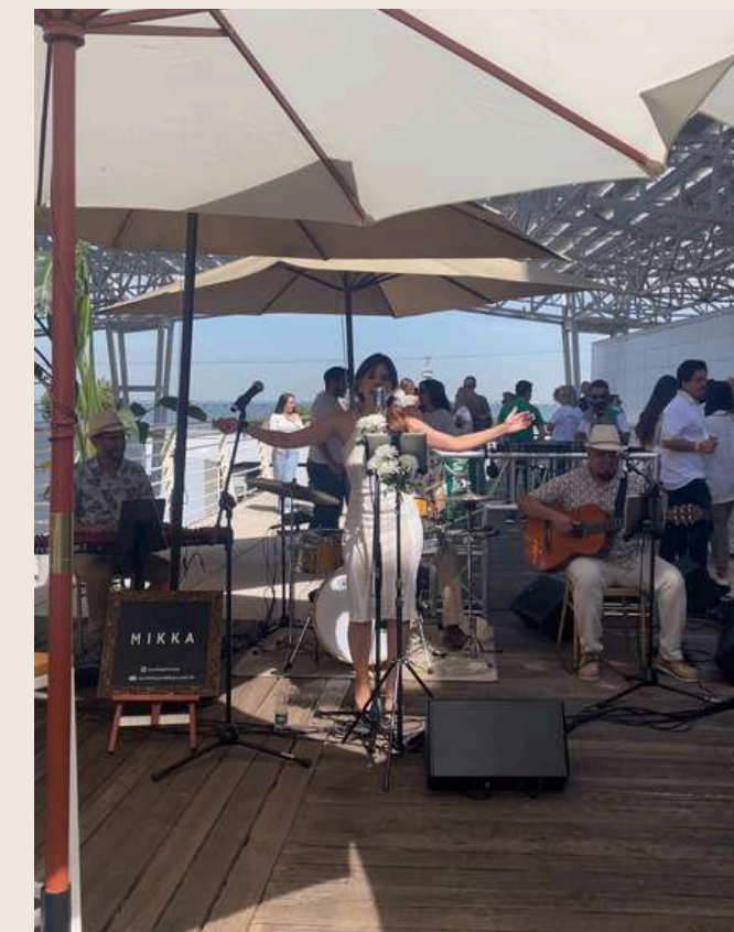
Brasilidade para evento do Sporting Clube Lisboa