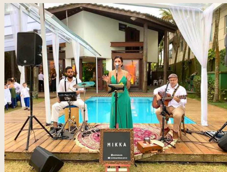
Trio em cerimônia no Guarujá - BR