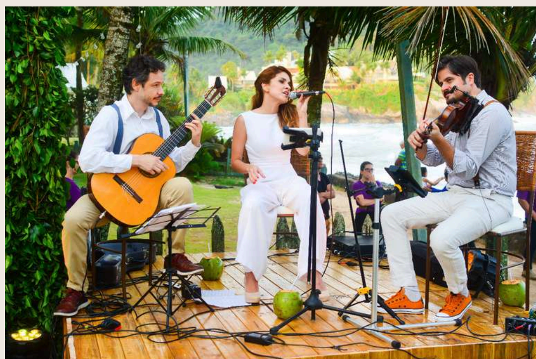
Trio em cerimônia em Maresias - BR